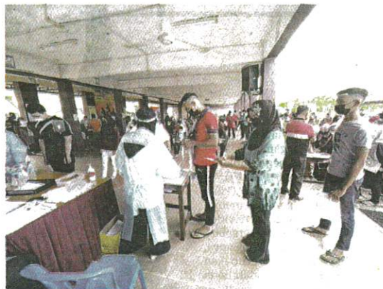
SEBAHAGIAN pelajar dan ibu bapa beratur menunggu giliran masing-masing bagi suntikan vaksin dos pertama di PPV SMK Sengal Petal, Pasir Puteh semalam.

"Ia turut merangkumi pelajar sekolah swasta, maahad tahfiz dan sekolah berasrama penuh," katanya ketika meninjau hari