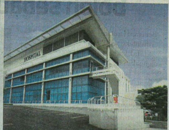
Hospital Columbia Asia di Cheras antara hospital swasta yang mempunyai klinik khas untuk membantu bekas pesakit Covid-19 mengubati sindrom Long Covid yang mereka alami.