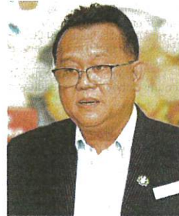
Datuk Seri Alexander Nanta Linggi

Earlier last month, the ministry set the maximum retail price for a set of Covid-19 self-test kit at RM19.90, while the wholesale price was set at RM16 effective Sept 5.