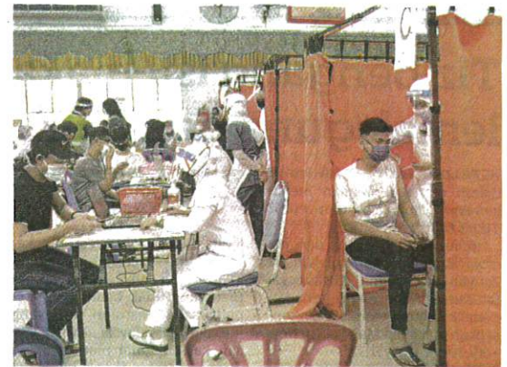
PETUGAS kesihatan memberikan suntikan vaksin kepada pelajar di Sekolah Menengah Kebangsaan Sultan Sulaiman 1, Kuala Terengganu semalam.

"Saya ucapkan terima kasih kepada ibu bapa yang memberi kerjasama bagi membolehkan anak mereka divaksin dan anak-anak ini akan pulang semula ke sekolah dengan keyakinan yang tinggi memulakan sesi perse-