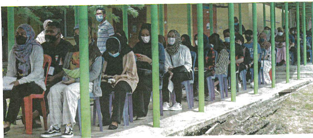
SEBAHAGIAN pelajar sekolah beratur untuk menerima vaksin dalam Program Imunisasi Covid-19 Kebangsaan (PICK) terhadap kumpulan remaja berusia 12 hingga 17 tahun di Sekolah Menengah Kebangsaan Sultan Sulaiman 1 di Kuala Terengganu semalam.

Katanya, seramai 308,186 remaja telah menerima dos pertama vaksin Covid-19 dengan Sabah merekodkan bilangan tertinggi iaitu 118,141 orang diikuti Sarawak (88,473); Kedah (19,453); Kelantan (17,413); Johor (16,019) dan Labuan seramai 2,523.