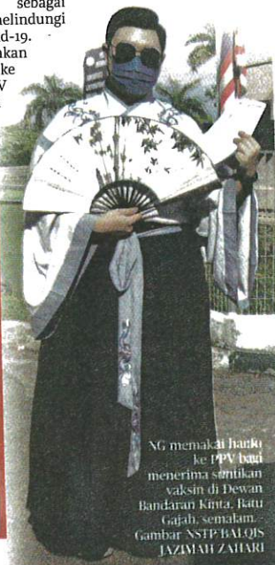
Ng memakai hanfu ke PPV bagi menerima suntikan vaksin di Dewan Bandaran Kinta, Batu Gajah, semalam.