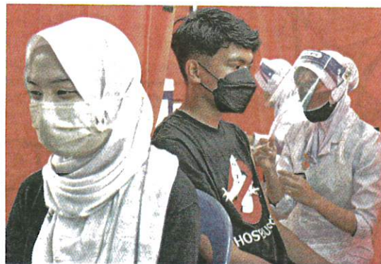
PETUGAS kesihatan memberi suntikan vaksin Covid-19 kepada pelajar sekolah di Sekolah Menengah Kebangsaan Sultan Sulaiman 1, Kuala Terengganu, semalam.

"Malaysia belum mempunyai keupayaan kerana tiada pelaburan dilakukan sejak dulu lagi, walaupun pernah melakukannya terhadap haiwan tetapi bukannya manusia. Oleh itu, perlu diutamakan untuk mendapatkan teknologi dalam men-