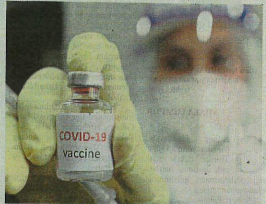
80 peratus penduduk dewasa di Malaysia sudah lengkap divaksinasi bagi membolehkan negara kini mencapai imuniti kelompok.

Kerajaan kini sedang mempergiat vaksinasi terhadap remaja berusia 12 hingga 17 tahun di seluruh negara bermula