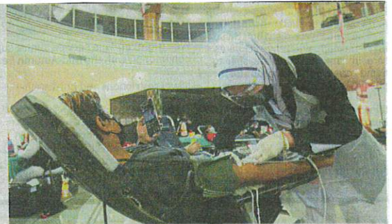
National Blood Centre employee attending to a donor during a blood donation drive in Rawang.

"These guidelines also set a temporary suspension period for blood