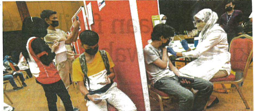
Sebahagian pelajar yang menerima suntikan vaksin di PPV Dewan Canselor MSU, Shah Alam, semalam.