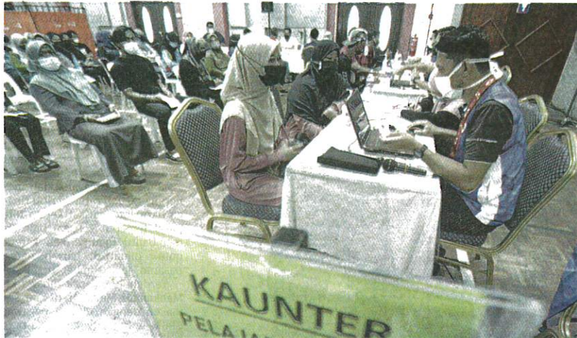
PARA pelajar yang menerima suntikan vaksin Covid-19 di PPV Dewan Dato' Bahaman, Kuala Pilah, semalam turut ditemani ibu bapa dan penjaga masing-masing.

"Bagi remaja yang telah mendapat tarikh vaksinasi di PPV Sekolah, kumpulan pelajar ini perlu mengekalkan janji temu sedia ada di PPV Sekolah yang telah ditetapkan dan tidak dibenarkan walk-in ke PPV Awam atau Integrasi," katanya menerusi satu