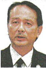
Tan Sri Dr Noor Hisham Abdullah.

"However, the effectiveness of this device is dependent on its