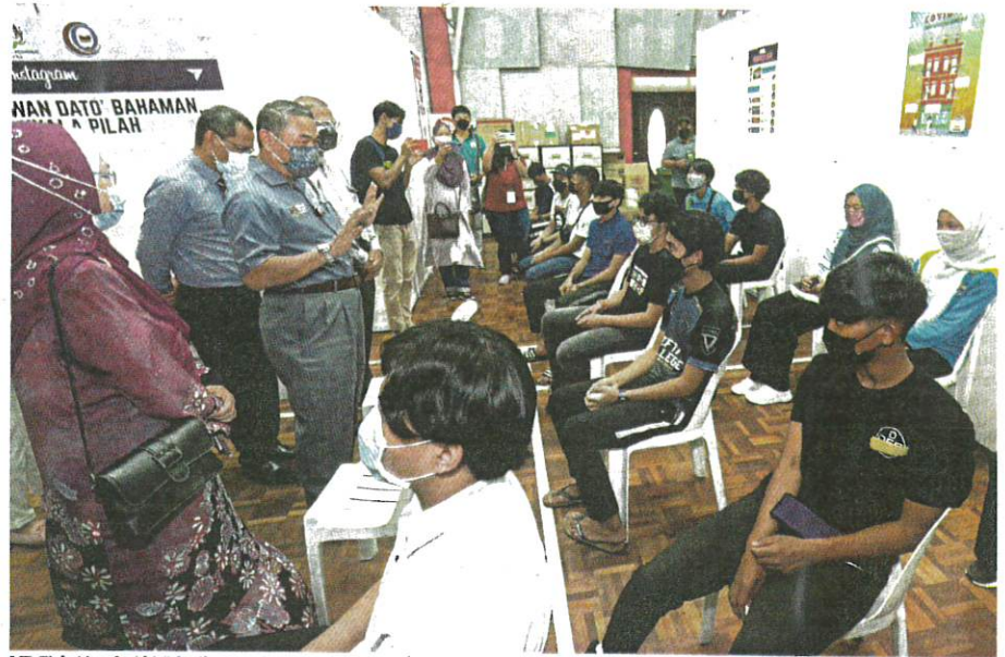
MD Fiah (tiga dari kiri) ketika membuat tinjauan pemberian vaksin kepada pelajar di Pusat Pemberian Vaksin (PPV) Dewan Dato Bahaman Shamsudin, Kuala Pilah, semalam.

Selain itu, Sabah merekodkan 19 kematian, Perak (15), Sarawak (8), Kedah (6), masing-masing empat kes di Pahang dan Terengganu, Melaka (3) serta masing-masing satu kes di Perlis dan Negeri Sembilan.