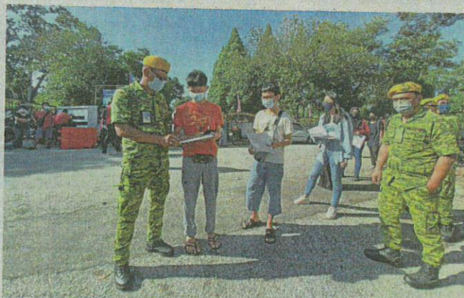
Everything in order: A teenager showing the relevant paperwork while he and others queue at the Dewan Bandaran Kinta PPV in Batu Gajah.

"We have a group chat and my class teacher updated us about our vaccination a few days ago.