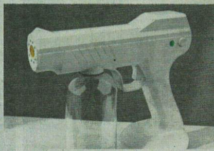
Semburan kabus nano tidak mampu ganti kaedah pembersihan permukaan secara manual.

Beliau berkata, buat masa ini terdapat beberapa larutan disinfeksi yang mengandungi alkohol