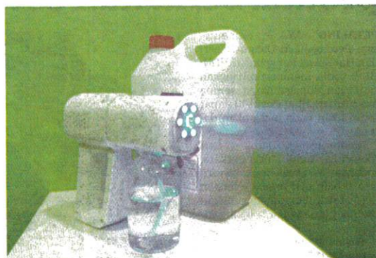
ALAT semburan nano mist yang banyak dijual di pasaran dalam negara tidak menggantikan keperluan nyahkuman permukaan secara manual. – GAMBAR HIASAN

Nano mist spray adalah alat penyembur yang boleh menghasilkan titisan halus bersaiz nano dan digunakan bagi pelbagai tujuan termasuk kosmetik, wangian dan pelbagai kegunaan