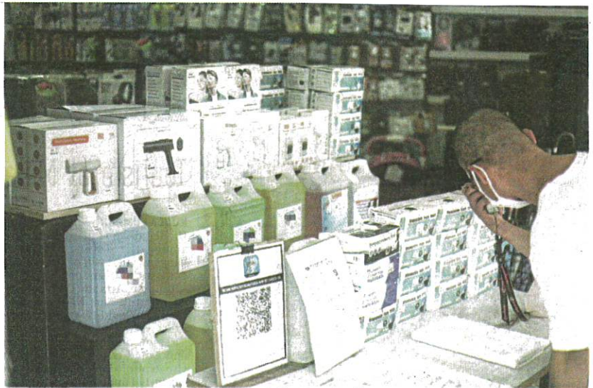
Nano mist spray is available in many forms and sizes, ranging from spray gun and handheld spray for personal use.

use. It is available in many forms and sizes, ranging from spray gun and handheld spray for personal use and larger size for industrial