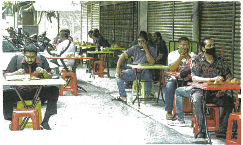
INDIVIDU lengkap vaksinasi kini diberi kelonggaran untuk dine-in di kedai makan. – FARIZ RUSADIO

Bagi fasa ketiga pula, bermula Mei disasarkan untuk sekitar 13.7 juta penduduk di Malaysia berumur 18 tahun ke atas, sama ada rakyat tempatan atau warga asing.